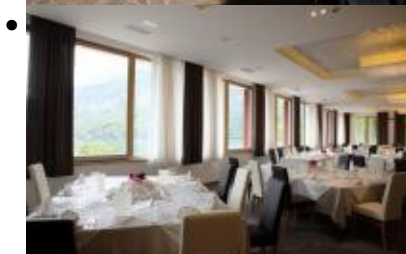
Hotel Molveno, Strutture alberghiere