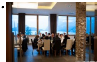
Hotel Molveno, Strutture alberghiere