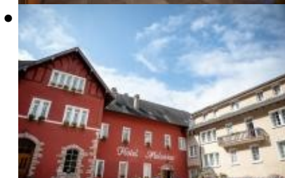
Hotel Molveno, Strutture alberghiere