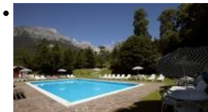
Hotel Molveno, Strutture alberghiere