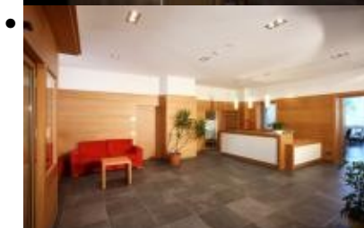
Hotel Molveno, Strutture alberghiere