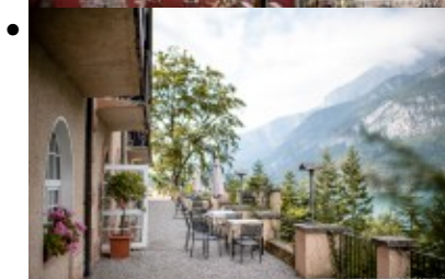
Hotel Molveno, Strutture alberghiere